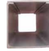
Flanşlı Tip Kablo Kanalı