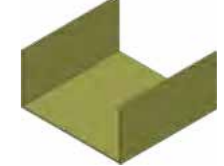
Kanal ve Fittings Bağlantı Mufu