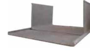
Kilitli Tip Kablo Kanalı